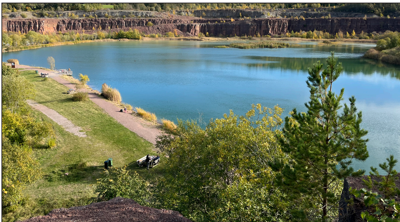
Kinnekulles stora stenbrott.