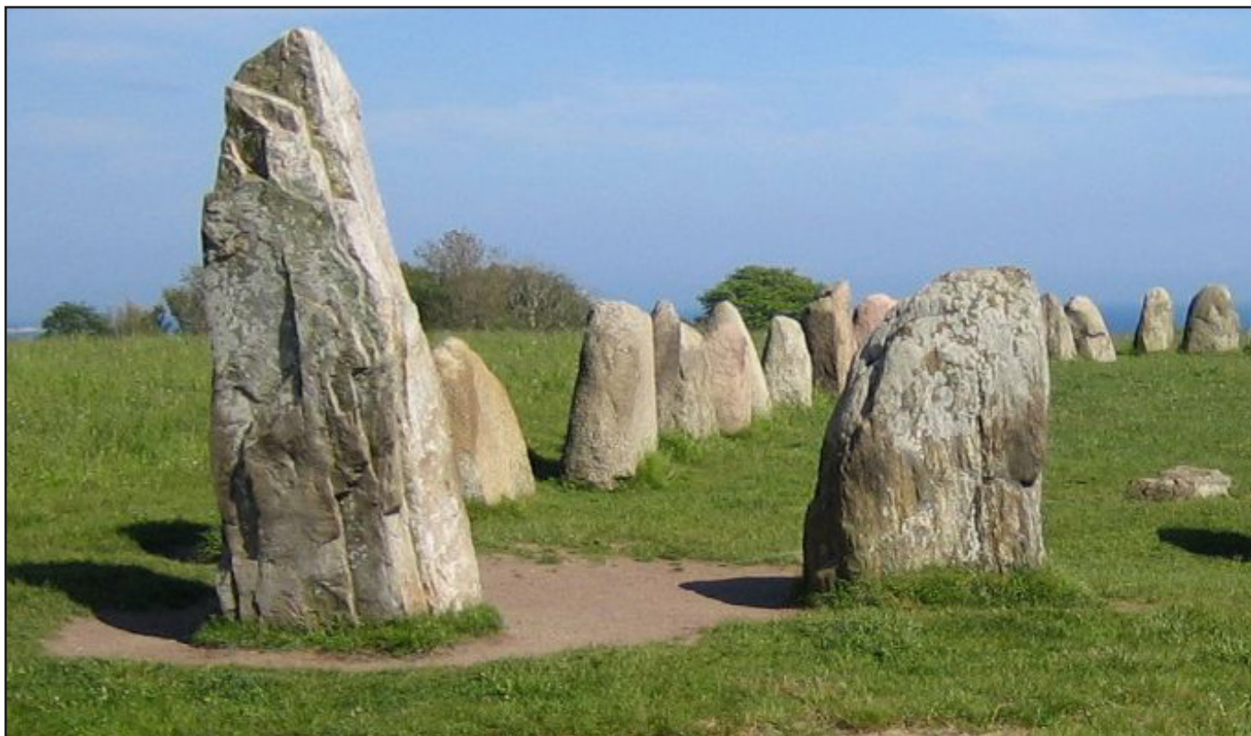
Ale stenar.

västra sida på Västra Bangatan, framför västra ingången till stationsområdet.